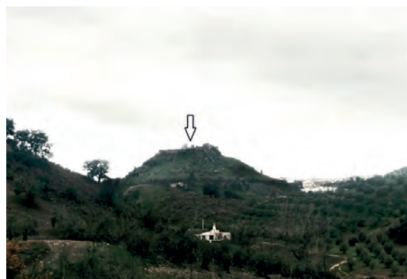
Lám. 1: Imagen del Cerro del Castillo de Carcabuey.

Por desgracia, y a falta de intervenciones arqueológicas en el Cerro del Castillo, se cuenta con pocos datos sobre las características urbanas del municipio de Ipolcubulcula.