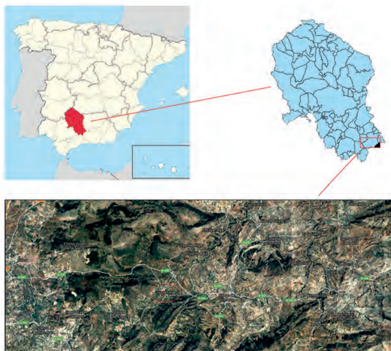
Fig. 1: Situación del municipio de Carcabuey.

OSUNA, 2002: 98). Solamente una intervención arqueológica en el sitio arrojaría un poco de luz en este sentido. Con respecto al final de su ocupación, los materiales recuperados en la prospección a la que aludíamos anteriormente indican que, para los siglos IV-V d.C., el asentamiento se encuentra desocupado, pues no aparecen materiales adscribibles a este periodo (CARRILLO, 1991: 240). Esta crisis va en consonancia con la dinámica de toda esta zona para este periodo, pues tras una explosión poblacional fechada a mediados del siglo I d.C. en la que los asentamientos se multiplicaron, a partir de mediados de la siguiente centuria éstos comienzan a desocuparse, manteniéndose ocupados solamente una pequeña parte, dinámica de la que Ipolcubulcula no escapó. Aunque también conviene señalar que en sus alrededores sí que se han localizado materiales de cronología más tardía, aunque de procedencia incierta, como apuntaremos más adelante.