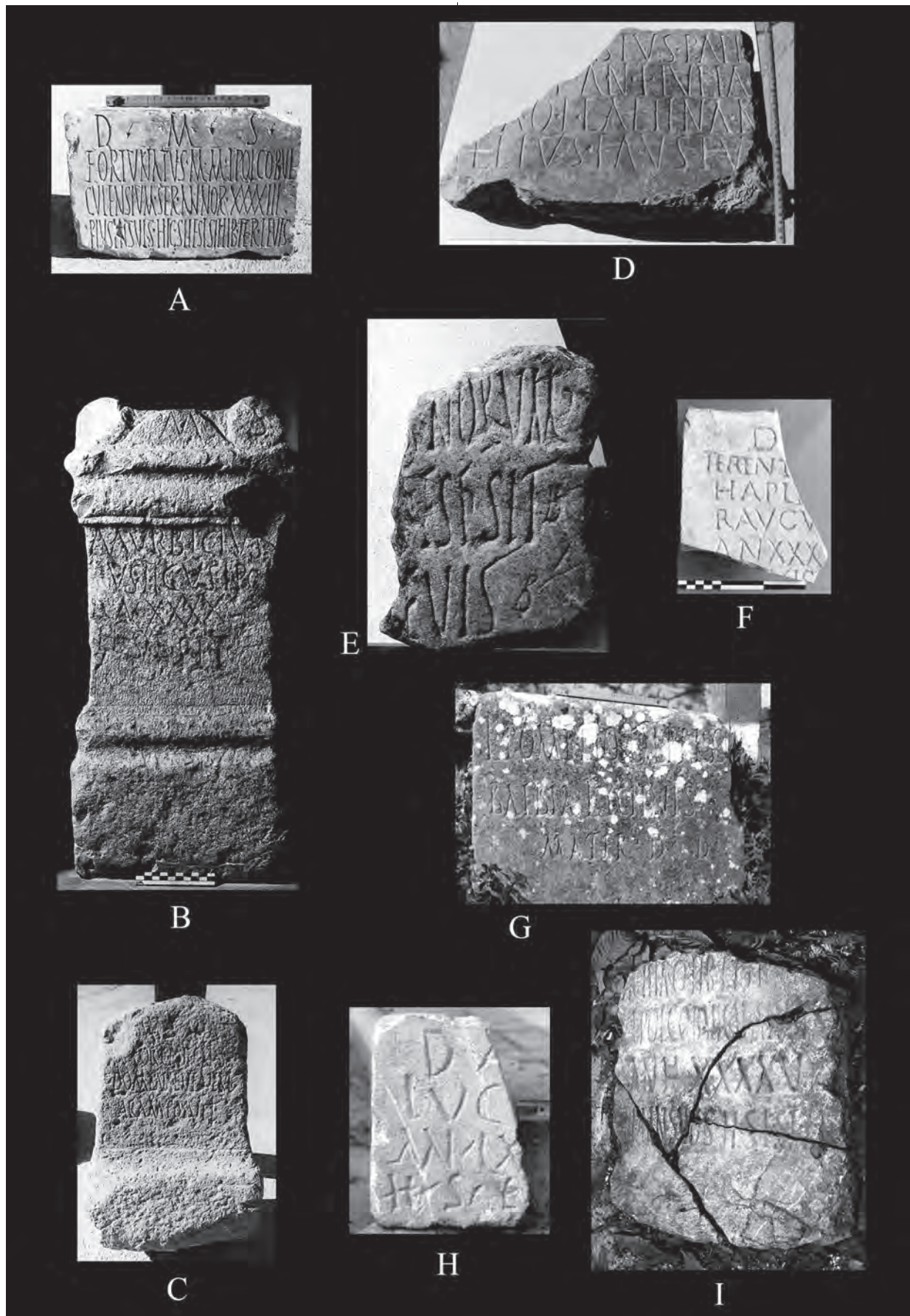
Lám. 2: Diferentes inscripciones localizadas en el territorio de Ipolcobulcula (elaboración propia a partir de imágenes extraídas del CIL).