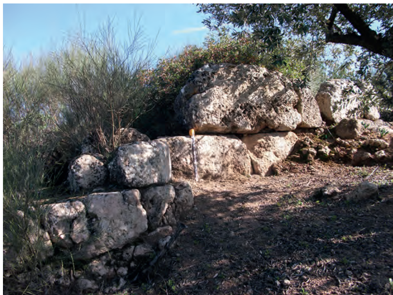
Lám. 3: Recinto fortificado de la Fuente Catalina (Carcabuey, Córdoba).

en el Montecillo de Valdecañas, en el Cerro Nevado, y en el Cerrillo de la Zamora, todos en el término municipal de Carcabuey (OSUNA, 2002: 96-97).