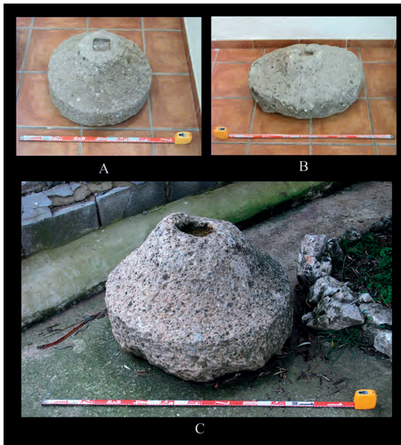
Lám. 5: Metas de molino de cereal documentadas en el entorno de Ipolcobulcula. A y B, procedentes del casco urbano de Carcabuey (Córdoba). C, procedente del yacimiento de El Tajo (Zagrilla Alta, Priego de Córdoba).

Julia, en el valle del río Genilla (OSUNA, 2002: 122-123). Esta dispersión entre los asentamientos rurales de los alrededores del municipio puede estar detrás de la aparición de varios elementos de cronologías situadas entre los siglos IV y V d.C., cuando parece que el municipio ya ha sido abandonado. Así, en el Museo Histórico Municipal de Priego de Córdoba se conservan varios objetos de bronce (aleaciones de cobre) procedentes del término municipal de Carcabuey, aunque el lugar exacto de su hallazgo es desconocido. Es el caso, por ejemplo, de dos calderos. El primero de ellos fue hallado junto a otros recipientes (calderos y platos), ingresando en el museo mediante el depósito de un particular en 1990. Ha sido fechado en época bajoimperial, entre los siglos IV y V d.C. (POZO, 1998: 49). Con respecto al otro, ingresó en el museo en 1988, también como depósito de un particular, y también se ha propuesto una cronología similar a de la pieza anterior, entre los siglos IV y V d.C. (POZO, 1998: 49). Por otro lado están tres platos, también de bronce. El primero de ellos fue depositado en el museo con el primero de los calderos a los que aludíamos más arriba, en 1990, mientras que los otros dos lo fueron con el segundo de los calderos, un par de años antes, en 1988. Todos han sido fechados en la